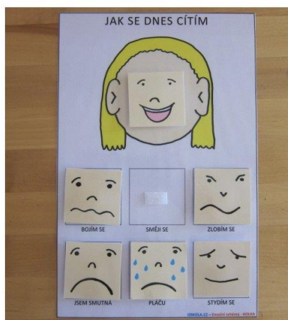
Schéma zakoupené u prodejce:

Hodnocení: Uživatel rozpozná své emoce nebo u druhých lidí, využívá emoční schémata v běžném životě ke komunikaci.